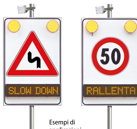
Esempi di applicazioni Safety Radar