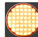
LEDBOX BASIC 201