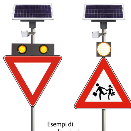
Esempi di applicazioni Safety Radar Solar box