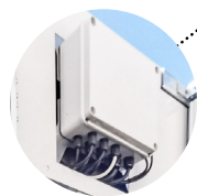
Centralina fig. 400