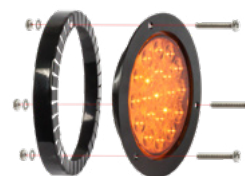
Adattatore per Basic 102